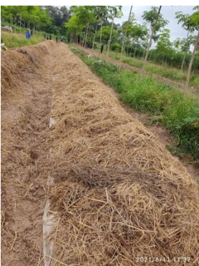
โรยเชื้อ กลุ่มพลาสติก และเห็ดฟาง