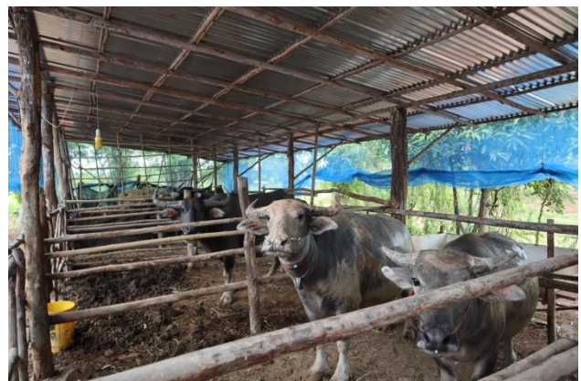
โรงเรือน