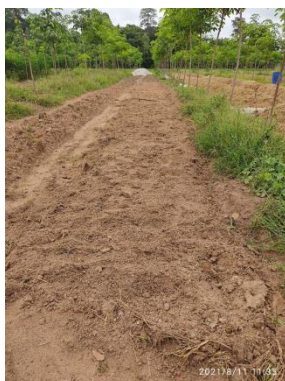
ไถเตรียมดิน