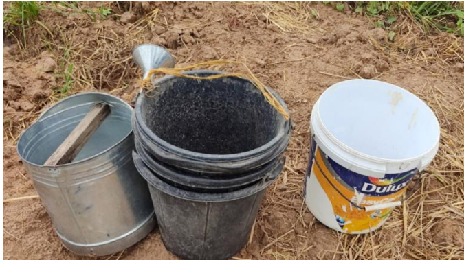
บัวรดน้ำ ถังน้ำ