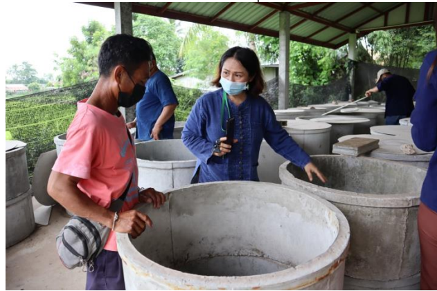
สภาพโรงเรือน