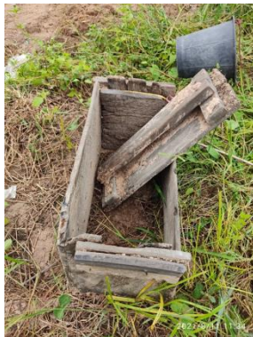
แบบอัดขี้มัน