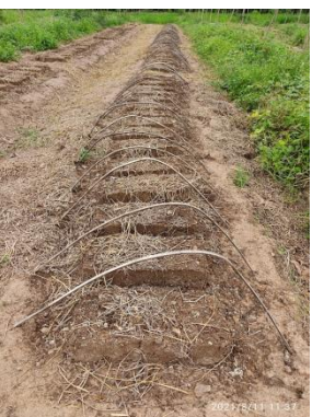
อัดบล็อก ตัดโครงไม้ไผ่