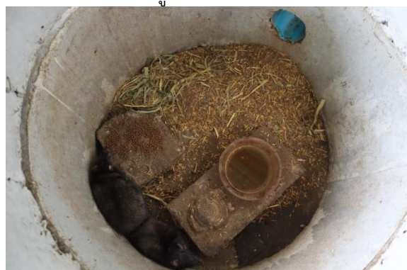
ภายในท่อซีเมนต์