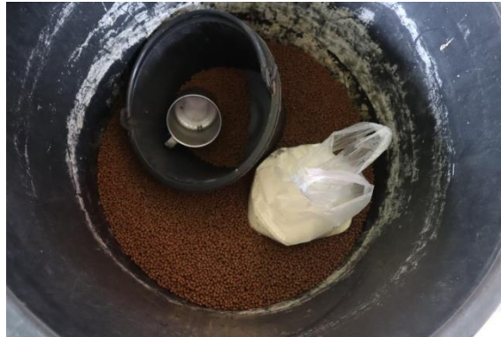
อาหารเม็ด สำหรับปลาตุ๊ก