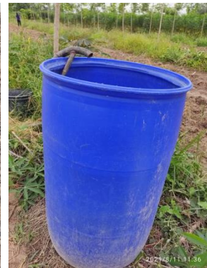
ถังใส่น้ำ