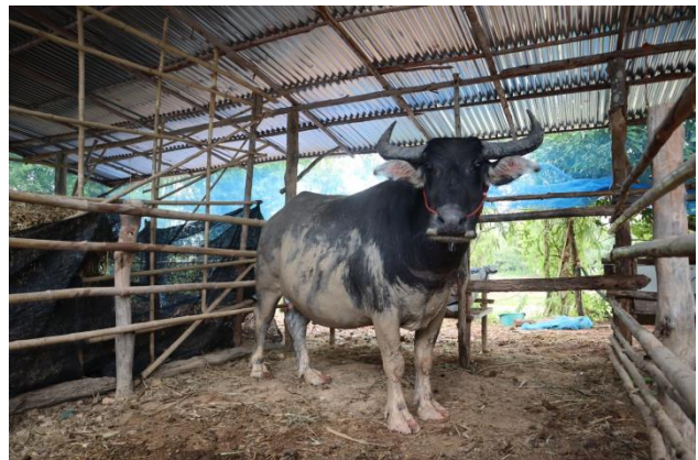
ลักษณะของควาย