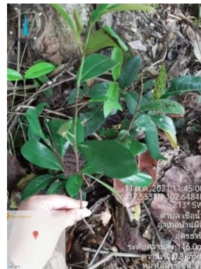
น้ำเต้าน้อย