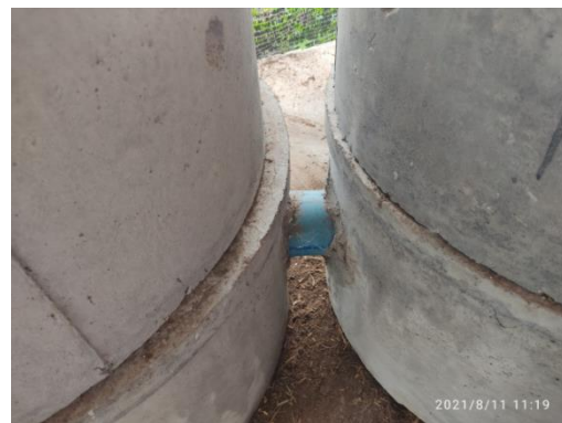
ท่อซีเมนต์ ๒ ท่อต่อกัน และเจาะรูท่อใส่ท่อ พีวีซี ให้หนูลอดไปมาได้